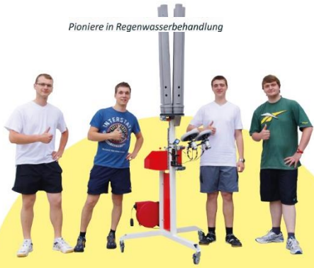
Pioniere in Regenwasserbehandlung